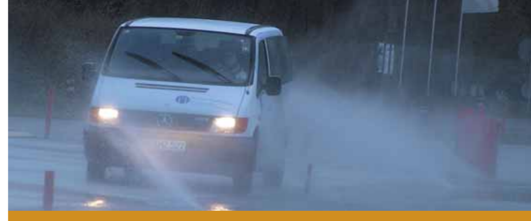
Fahrsicherheitstraining – Augsburg, 22.11.2004