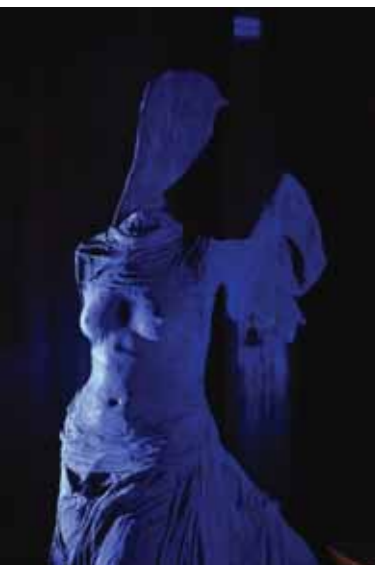
Nike von Samothrake 190 v. Chr., Marmor, 245 cm, Paris, Louvre Nike von Neubeuern 2004, Gips, 245 cm, Bibliothek Schloss Neubeuern