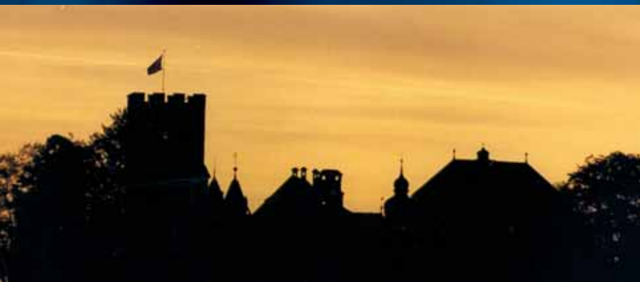
Geheimnisvolles Schloss Neubeuern. Ort für viele Begegnungen mit Lebensgeist.

So lange es Neubeuern gibt, so lange gibt es auch die Legende der »Blauen Frau«. Von wunderschöner Gestalt soll sie sein, umhüllt von einem Hauch aus blauem Tuch. Niemand