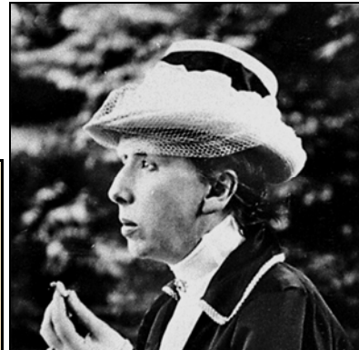
Gästebücher Bd. V S. 69

war eine deutsche Schriftstellerin. Sie setzte sich nachhaltig für den Frieden ein und erwarb sich Verdienste um die deutsch-französische Verständigung. In Romanen beschäftigte sie sich kapriziös-anmutig mit dem High-Society-Leben