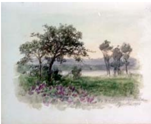
42 Aquarell „Innlandschaft“ Sig. L. Begas Parmentier (KV) 30/9-12/10 1896