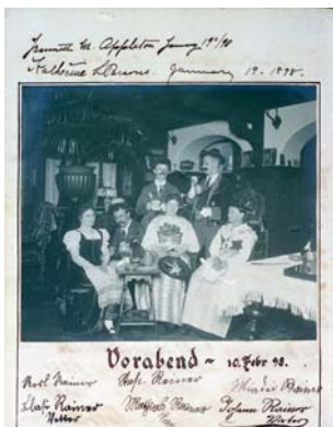
103 Foto Familie Rainer ? Vorabend 10. Febr. 98