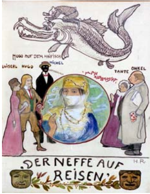
188 Aquarell „Der Neffe auf Reisen“ Sig. H.R. Hans Rossmann (KV)