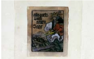
99 Aquarell „gott vatter mit inn und schloß“ als guets zum neuern Jahr H.R. Hans Rossmann (KV)