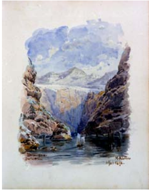
58 Aquarell „Zermagna Dalmatien“ Sig. M. Kleiber 21.11.96 (KV)