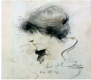
98 Bleistiftzeichnung „Damenportrait“ 26.XII 97