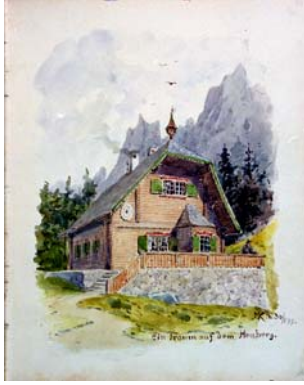
150 Aquarell „Ein Traum auf dem Heuberg“ (Heuberghütte) Sig. MK 30/199 Martin Kleiber (KV)