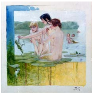
6 Aquarell „Badende“ Sig. JS Josef Sattler