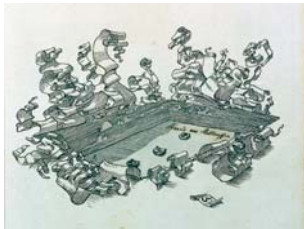
4 Radierung Sig. S. Josef Sattler (KV)