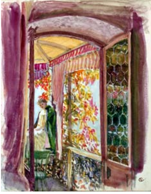
38 Aquarell "Frau am Fenster" Sig. CP Clemens Pausinger (KV)