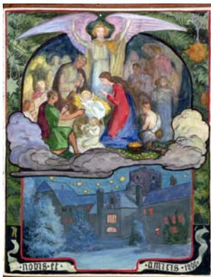
186 Aquarell „ Heilige Nacht im Schloß nobis et amicis 1899“ Püttner?