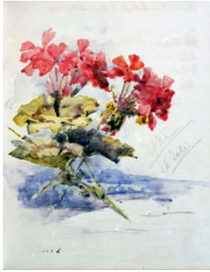
116 Aquarell „Blumen“ Sig. Ilka (KV) 26 Juli