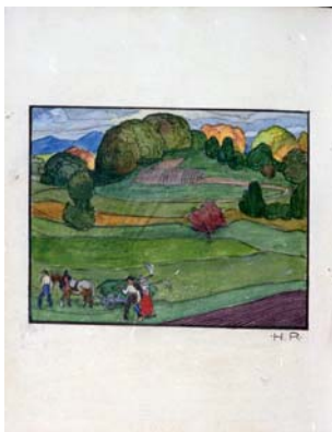
187 Aquarell „Bauern auf dem Feld“ Samerberg Sig. H.R. Hans Rossmann (KV)