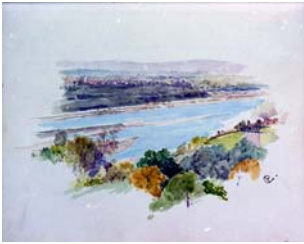
40 Aquarell „Innlandschaft“ Sig. CP Clemens Pausinger (KV)