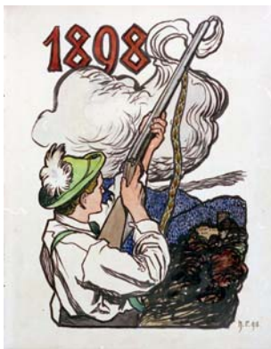
100 Aquarell „Gebirgsschütze vor Schloß“ 1898 Sig. h.r.98 Hans Rossmann (KV)