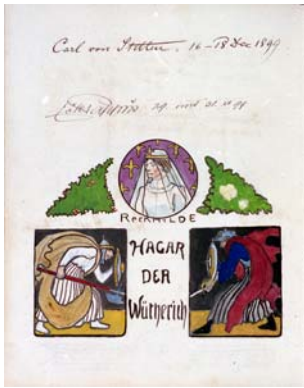
183 Aquarell „Hagar der Wüterich“ Püttner? Sig. Carl von Stetten 16.-18. Dec 1899