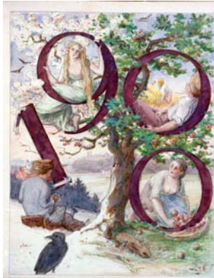
190 Aquarell „Baum mit Figuren – 1900 Blick von Hinterhör“ Künstler?