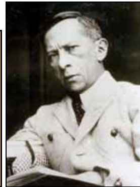
Gästebücher Schloss Neubeuern Bd. VI 1920

war ein deutscher Schriftsteller, Lyriker und Übersetzer.