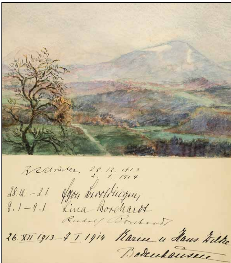
Gästebücher Schloss Neubeuern Bd. V S. 150