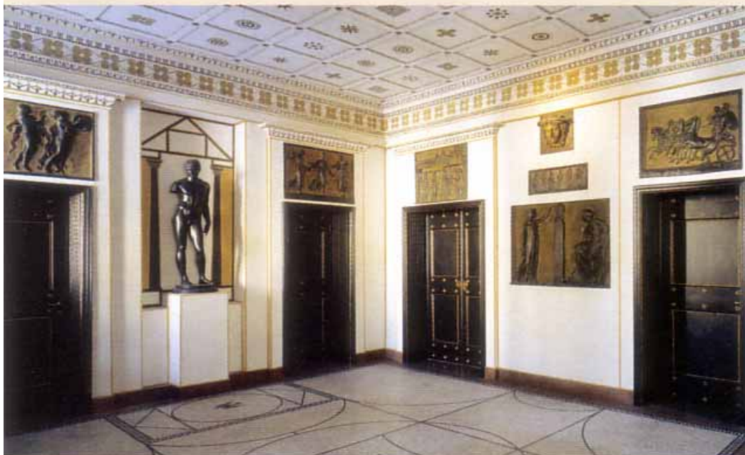
Frisch renoviert: das Vestibül des Stuck-Hauses mit seiner reichen Ornamentik

Museum Villa Stuck, Prinzregentenstraße 60 Tel.:089 4 55 56 10 Mi – So 11-19 Uhr www.villastuck.de