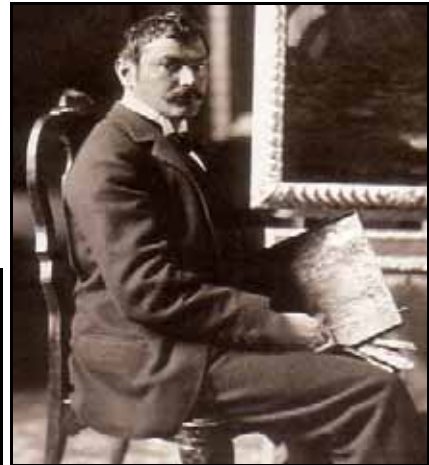
Franz von Stuck 1896 im Atelier