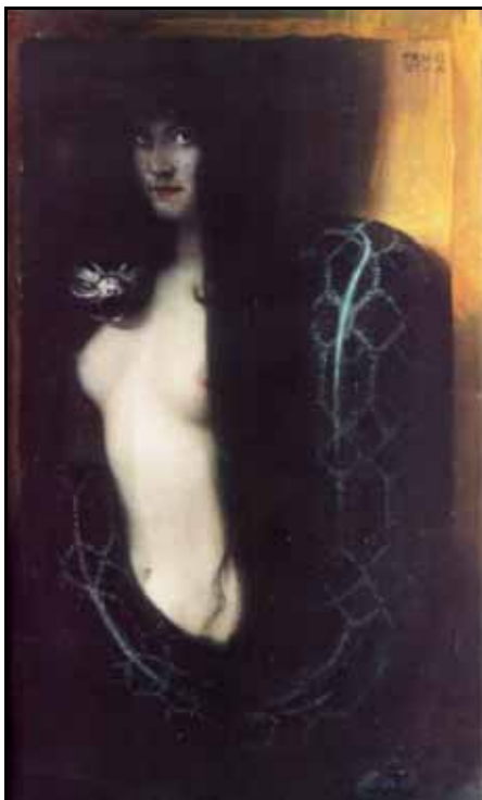
Skandalbild „Die Sünde“ (1893)