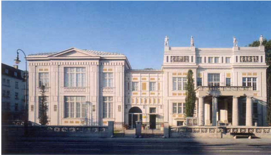
Nach der Wiedereröffnung: das Museum Villa Stuck an der Prinzregentenstraße