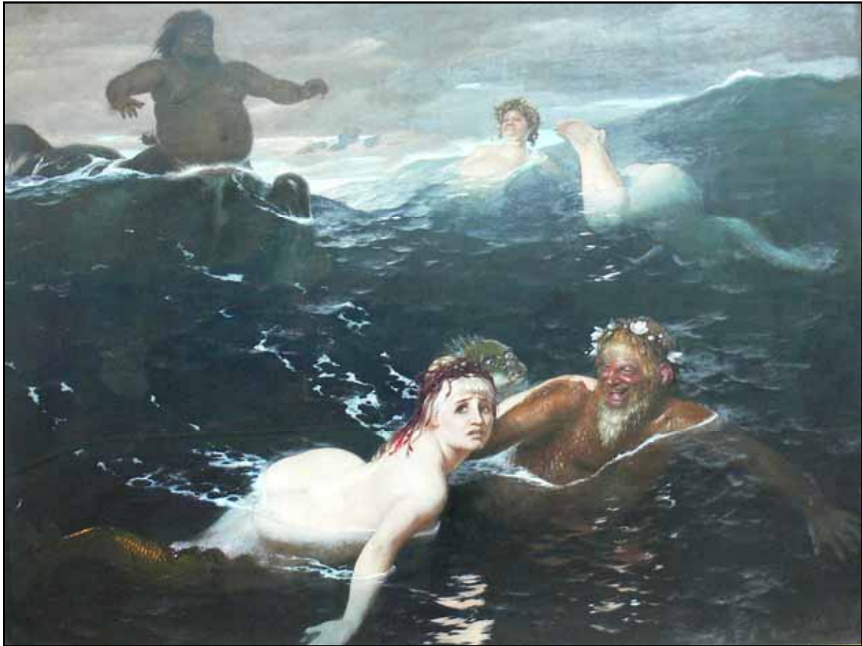
Arnold Böcklin „Im Spiel der Wellen 1883 Öl auf Leinwand, 180,0 x 238,0 cm 1888 als Schenkung aus Privatbesitz ( Jan Wendelstadt ) erworben Neue Pinakothek Inv.-Nr. 7754

Wie das Pan-Thema, so ist dasjenige der Tritonen oder Meerkentauren ein von Böcklin häufig verwendeter Bildgegenstand. Diese Meerwesen personifizieren hier in ähnlicher Weise den männlichen Eros. Die unmittelbare Anregung zu dem Bild scheint, wie so oft bei seinen Bilderfindungen, von einem persönlichen Erlebnis ausgegangen zu sein. Während eines zusammen mit der Familie des befreundeten Tiefseeforschers Anton Dohrn auf der Insel Ischia unternommenen Badeausflugs hat der Gelehrte durch langes Unterwasserschwimmen und plötzliches Auftauchen in nächster Nähe die Damen erschreckt und dabei Böcklins Phantasie dazu angeregt, den Eindruck in das Reich der Meeressäuger zu übertragen.