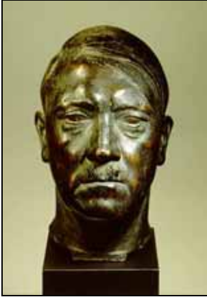
Adolf Hitler Bernhard Bleeker 1937 Bronze H 55,5 cm DHM, Berlin

Er überarbeitet seine 1935 im Auftrag der Reichsärztekammer erstellte Hitler-Büste mehrfach. Bis 1944 entstehen so 25 Exemplare für die Nationalsozialistische Deutsche Arbeiterpartei (NSDAP). Werke von ihm sind auf der Großen Deutschen Kunstausstellung vertreten.