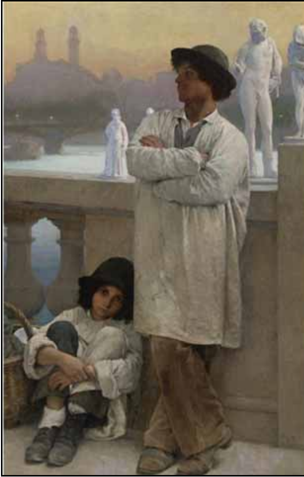
Junger Bildhauer auf einer Pariser Brücke, Alter Trocadero in Distanz Öl auf Leinwand 159 x 101,5 cm 1888 Sotheby´s New York, Dienstag, 23.10.2007