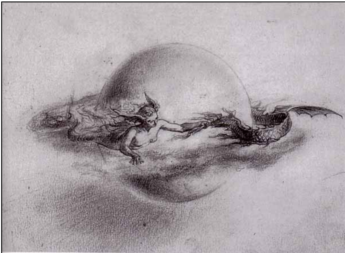
Fantasie und Studien um 1890