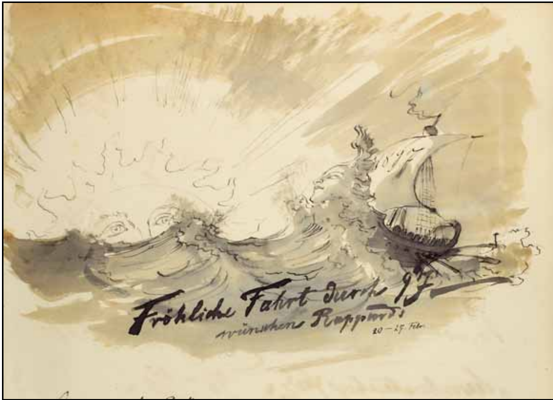
Gästebücher Bd. III S. 68