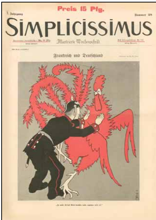
Deckblatt Oktober 1902 Heft 4 Jg. 28