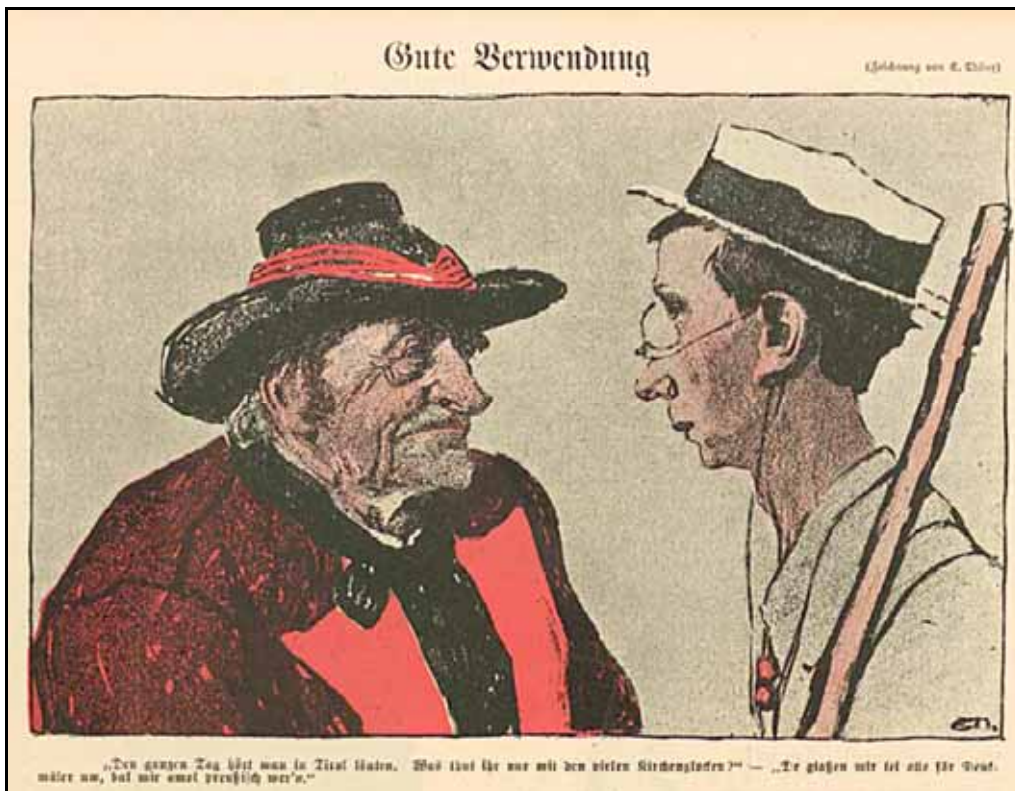
Oktober 1902 Heft 4 Jg. 28 S. 220