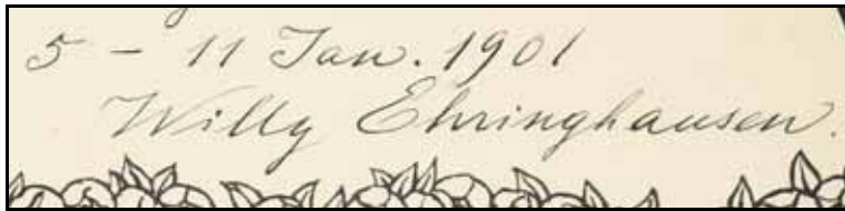
Gästebücher Bd. IV

Maler und Graphiker, Lebt in München, Schüler von Huber – Feldkirch u. Knirr , dann der Akademie unter Herterich und Fehr , sämtlich in München, später 1 Jahr in Rom, dann in München. Er war anfangs Landschaftsmaler, später vorwiegend Zeichner für Reproduktion (Buchschnuck, Postkarten u.dgl.) Besonders hervorzuheben sind seine (etwa 60) Exlibris, welche zu den beachtenswerten Leistungen auf diesem Gebiet zu rechnen sind.