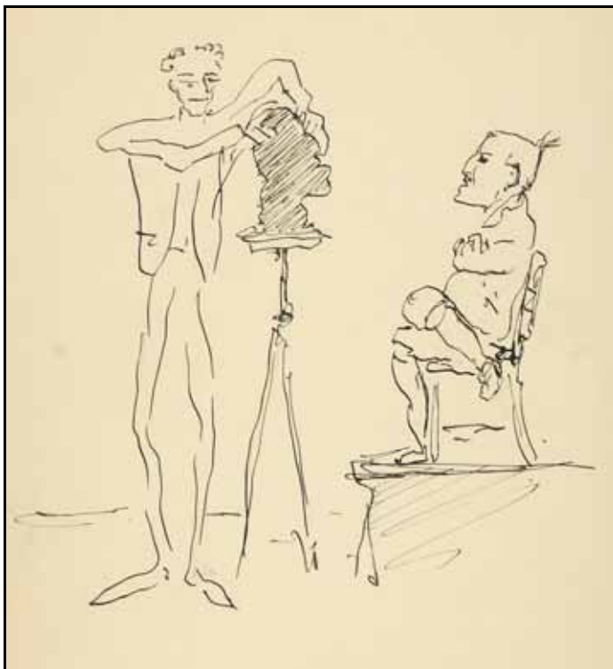
Fritz Behn modelliert Hugo von Hofmannsthal Gästebücher Bd. V