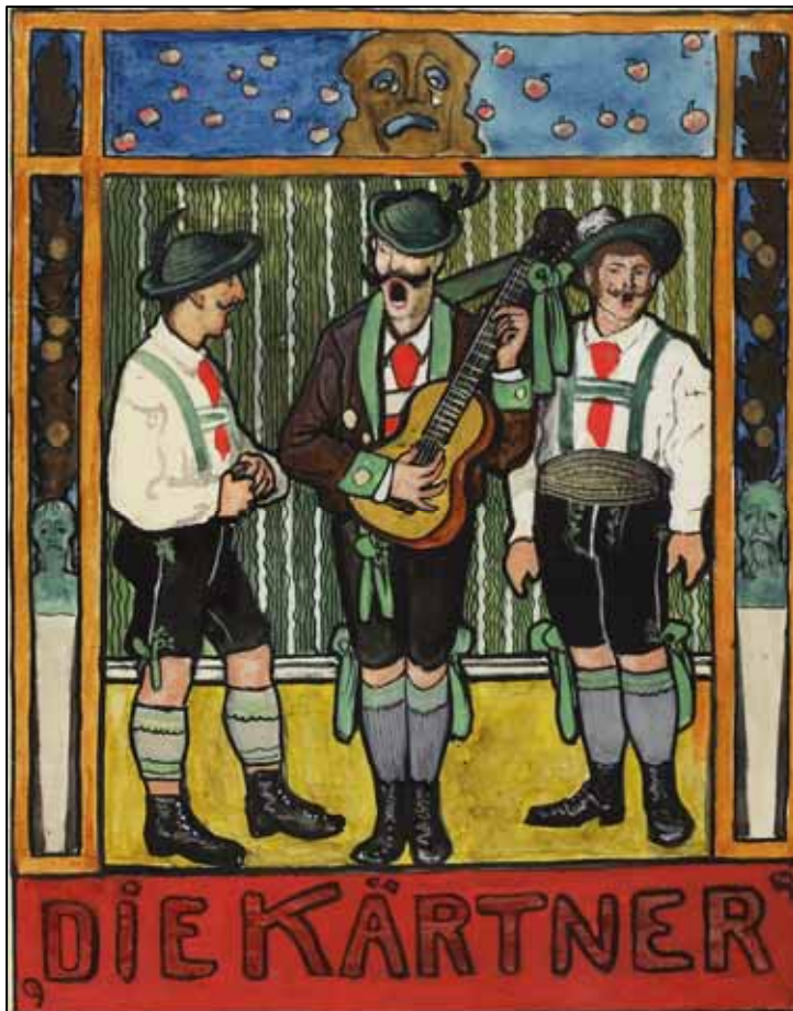
Gästebücher Band III S. 111, 112