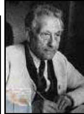
Gästebuch Gut Hinterhör 1946

war ein deutscher Arzt sowie Lyriker und Autor von Erzählungen.