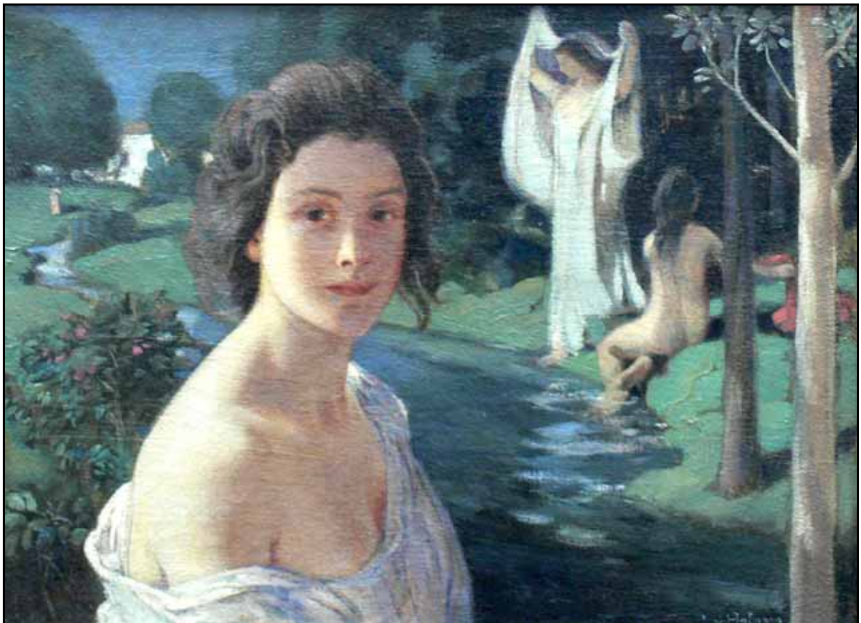
Ludwig von Hofmann Notturmo um 1897 Neue Pinakothek München