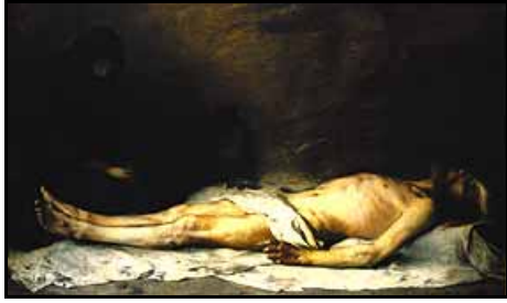
Stil: Pointilismus/ Neo-Impressionismus Kunstwerk: Die Beweinung Christi durch Maria Magdalena. Jahr: 1883