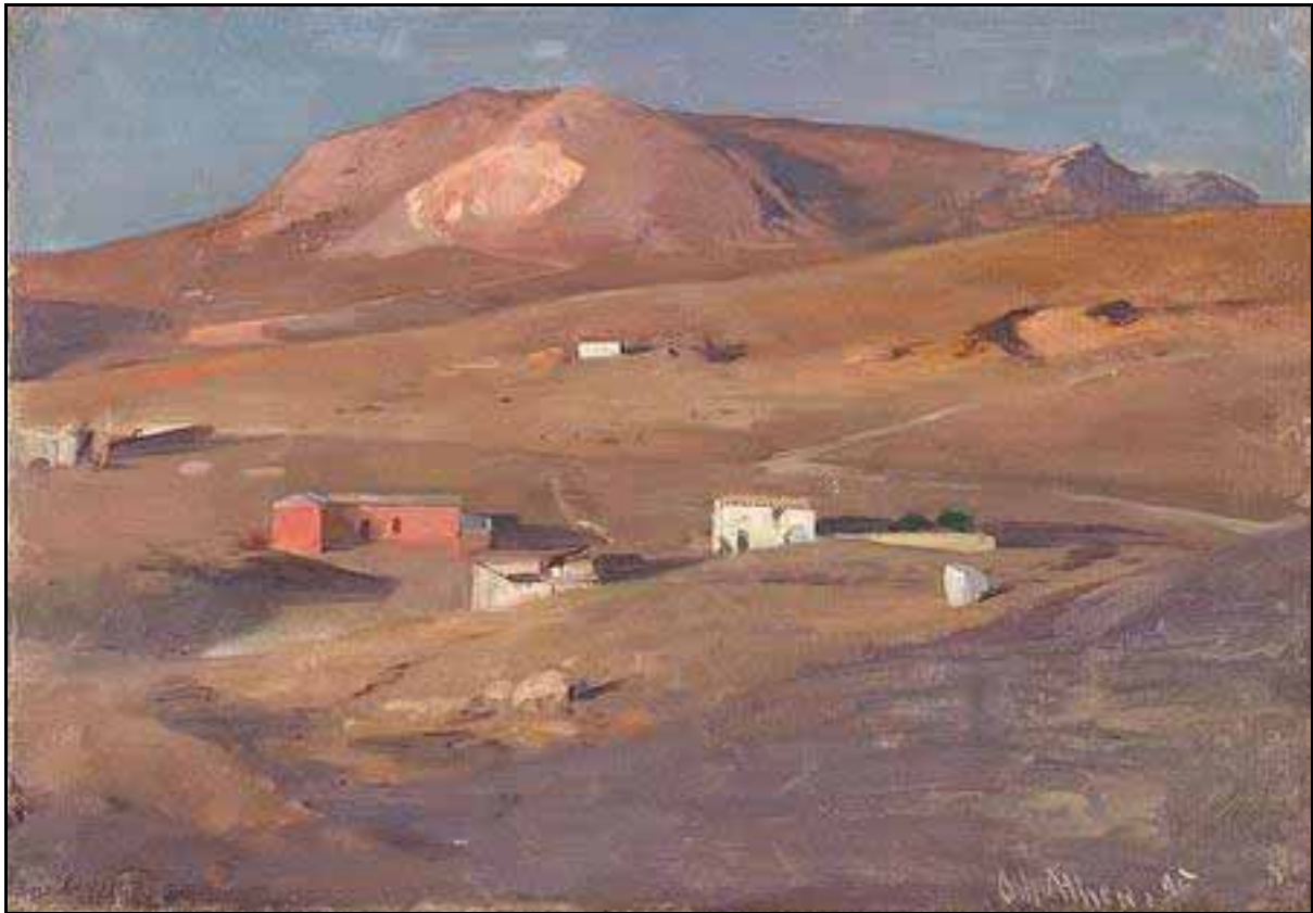
Ludwig von Löfftz, Abend bei Athen, 1895

http://www.kunstkopie-server.de/motive/Ludwig-von-Loefftz/Die-Beweinung-Christi-durch-Maria-Magdalena.-1006509.html