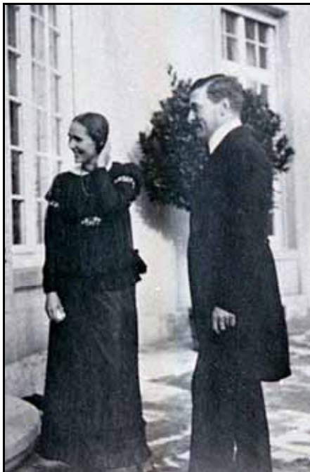
Grete Wiesenthal mit Hugo von Hofmannsthal bei den Stuttgarter „AriadneTagen“

Das Bild stellt Grete Wiesenthal dar, in ihrem Tanz im „Bourgeois gentilhomme“ („Der Bürger als Edelmann“) im Vorspiel zu „Ariadne auf Naxos“.