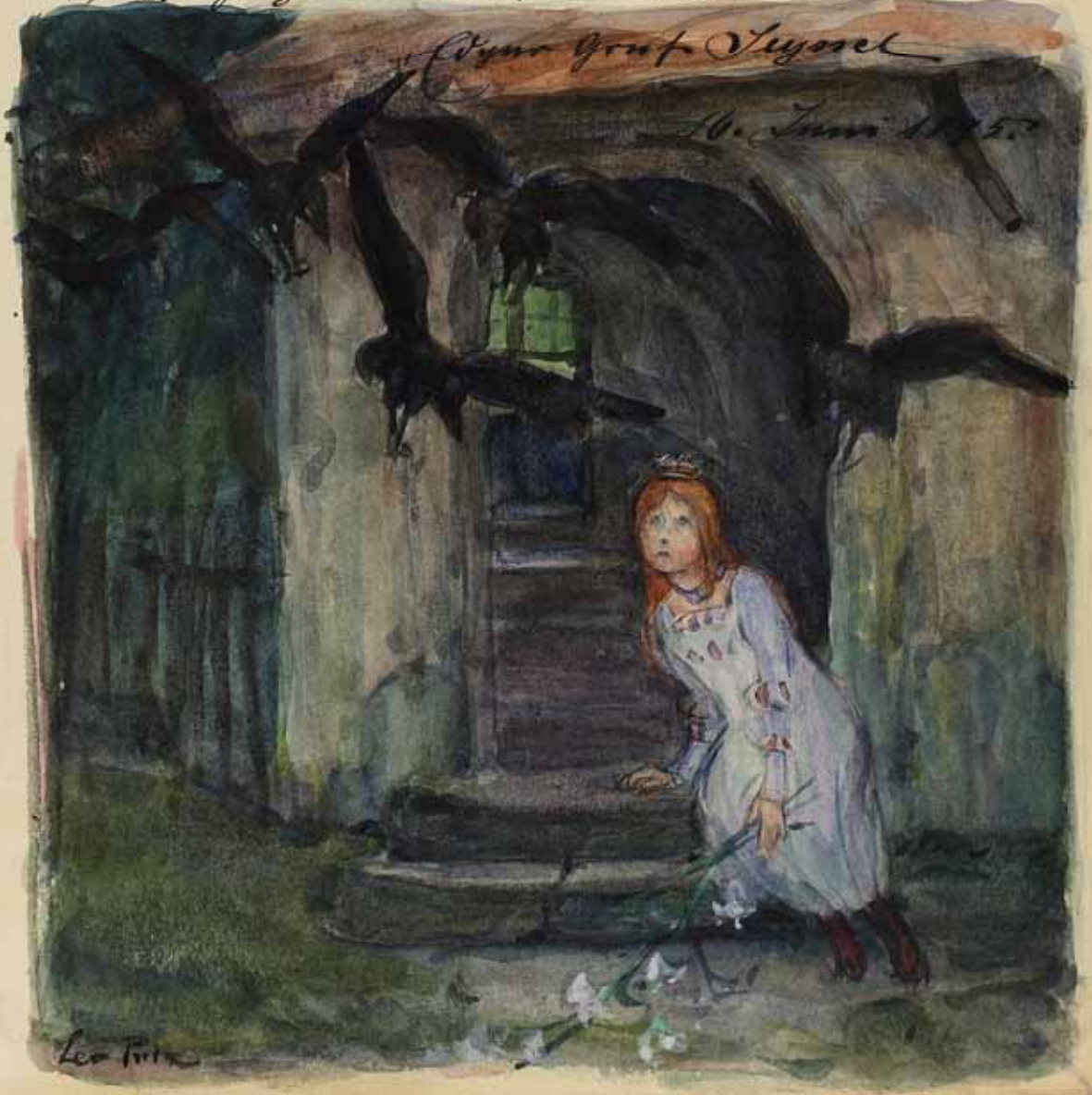
Bd. II S. 214 Mädchen am Schlossturm