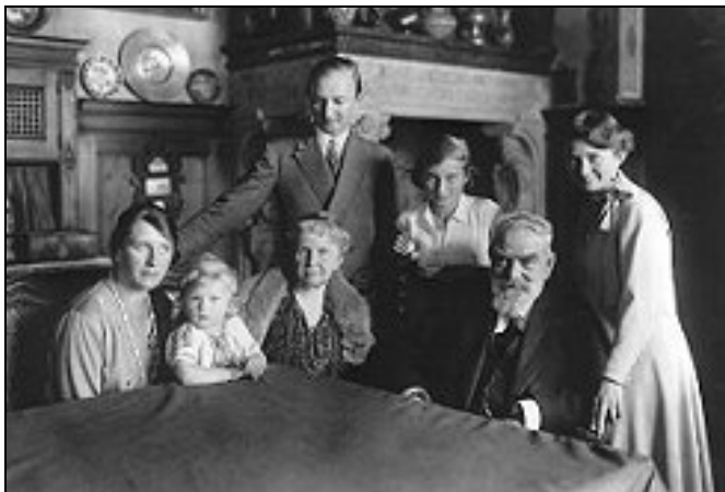
Oskar von Miller mit seiner Familie im Saal der Münchner Stadtwohnung am Ferdinand-von-Miller-Platz, 1930.