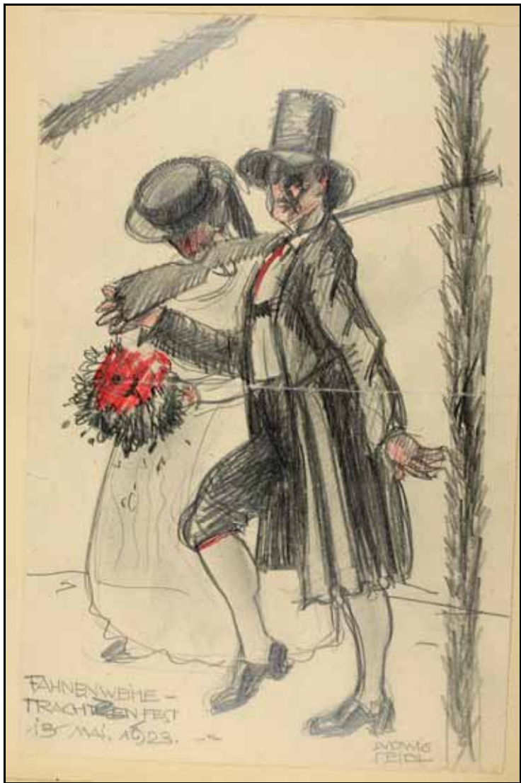
Gästebücher Bd. VI S. 167