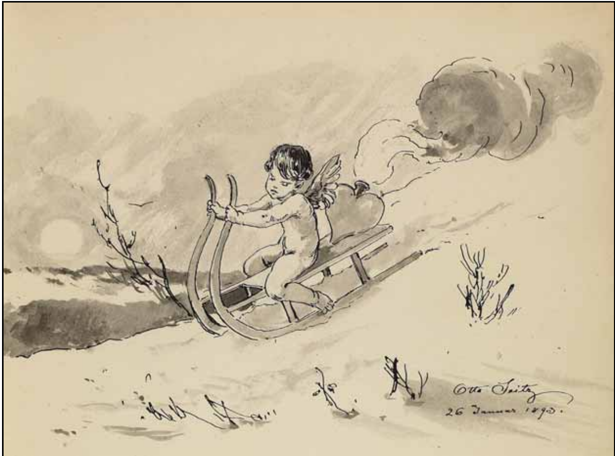
Gästebücher Bd. II S. 68