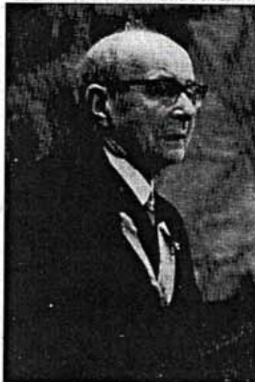
Der Gautinger Dichter Otto von Taube.

„Otto von Taube war ein bedeutender Dichter, der zu Unrecht klein gehalten wird.“ Das Gymnasium trage seinen Namen zu Recht.