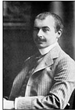
Gästebuch VII S. 103

Otto von Taube , Nachkomme eines alten baltischen Adelsgeschlechts, ist am 21. Juni 1879 in Reval/Estland geboren und am 30. Juni 1973 in Gauting bei München gestorben. Aufgewachsen ist Taube in dem Schloss des Großvaters in Estland. Die Erinnerungen an diese Zeit haben sich in seinen späteren Werken niedergeschlagen.