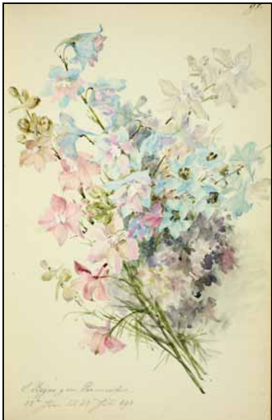
Gästebücher Bd. I S. 178, 200