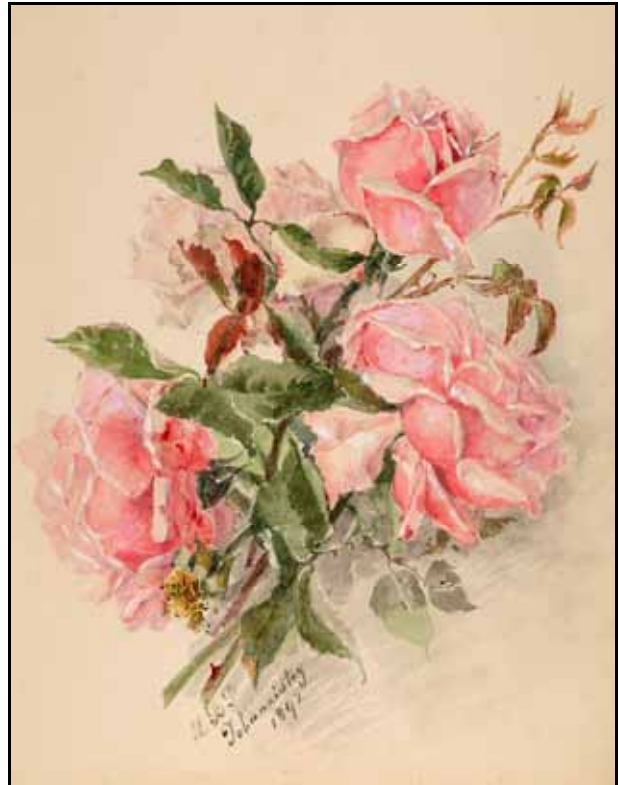
Gästebücher Bd. I S. 220, Bd. II 4