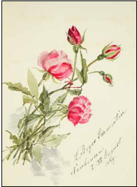
Gästebücher Bd. I S. 142, 174