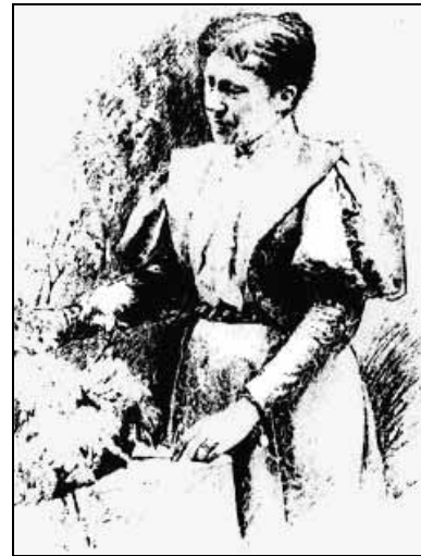
Gästebücher Bd. I S. 142

Landschaft –und Architekturmalerin, Schülerin des Landschaftsmalers Schindler u. des Radierers Wilhelm Unger . Ab 1876 waren ihre Architektur- und Landschaftsmotive regelmäßig auf der akademischen Kunstausstellung in Berlin zu sehen. In zeitgenössischen Berichten wurden ihre Bilder als „Meisterwerke an Stimmung, Poesie und Farbgebung“ bezeichnet. Seit dem Jahr 1877, in welchem sie sich mit Adalbert Begas (1863 – 1888) verheiratete, lebte sie in Berlin. In ihren trefflichen Architekturbildern, Landschaften und Blumenstücken hat sie fast ausschließlich italienische Motive behandelt. Namentlich fanden ihre Darstellung aus Venedig (auch Radierungen) und ihre Schilderungen von Südtalienenischen Gegenden Beifall.