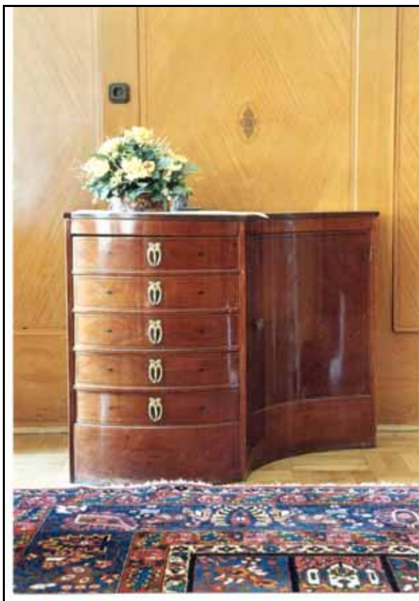
Kommoden von Bruno Paul im Schloss Neubeuern