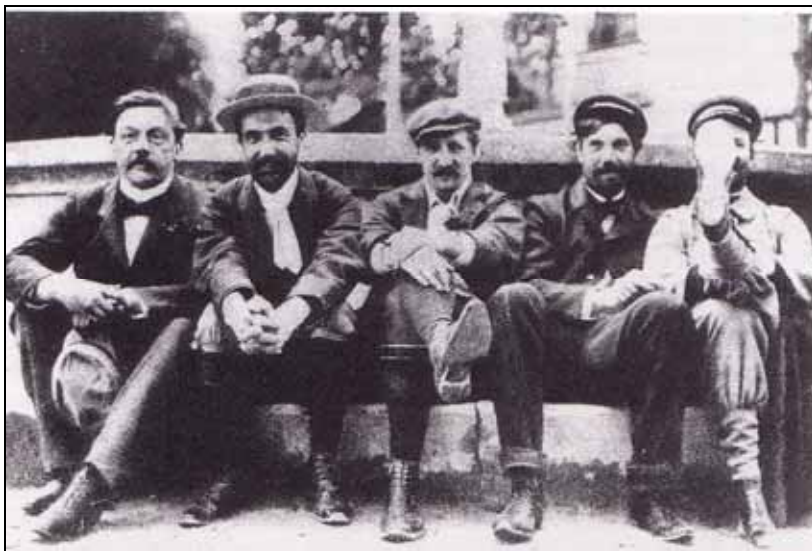
Die »Simpl-Redaktion« bei einem Ausflug nach Oberammergau 1900. Ludwig Thoma, Eduard Thöny, Bruno Paul, Rudolf Wilke und Ferdinand von Reznicek (v.l.n.r.)

Bruno Paul: Deutsche Raumkunst und Architektur zwischen Jugendstil und Moderne, München 1992, S. 18