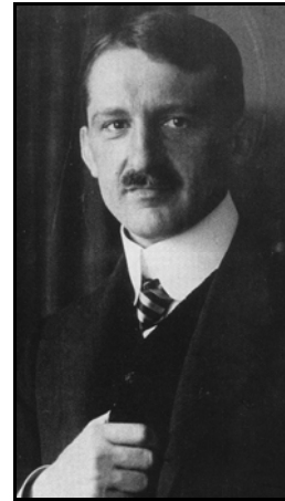
Bruno Paul S. 8

war als Architekt, Karikaturist und Kunsthandwerker ein Wegbereiter des Jugendstils. Er begründete den Deutschen Werkbund mit und war ein einflussreicher Hochschullehrer.