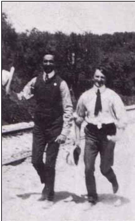
v.l. Eduard Thöny und Bruno Paul um 1900

Bruno Paul: Deutsche Raumkunst und Architektur zwischen Jugendstil und Moderne, München 1992, S. 18