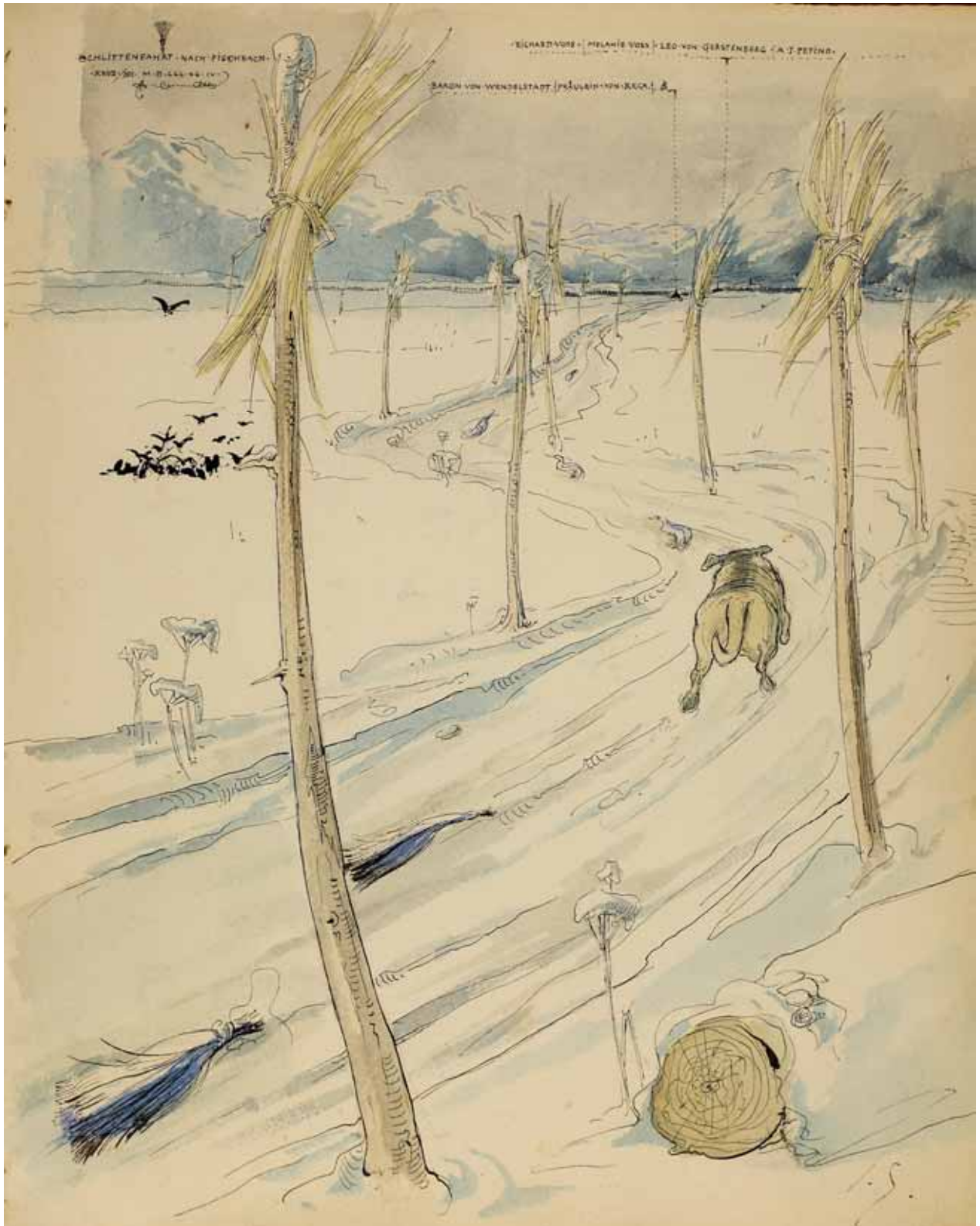
Gästebücher Bd. II S. 194 Schlittenfahrt nach Fischbach von Josef Sattler mit Melanie und Richard Voss