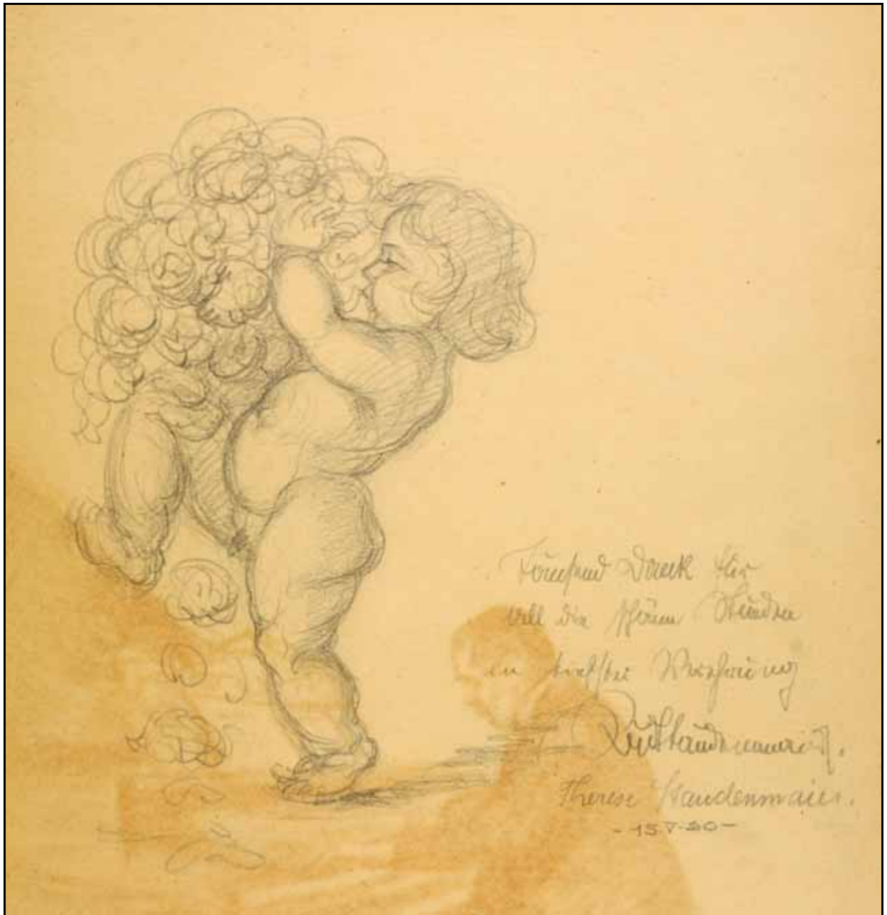
Gästebücher Bd. VI S. 106