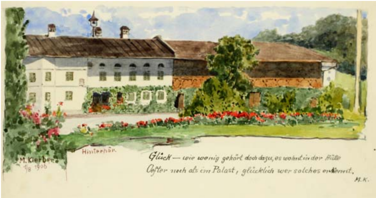
Hinterhör 1906 Gästebücher Bd. 4