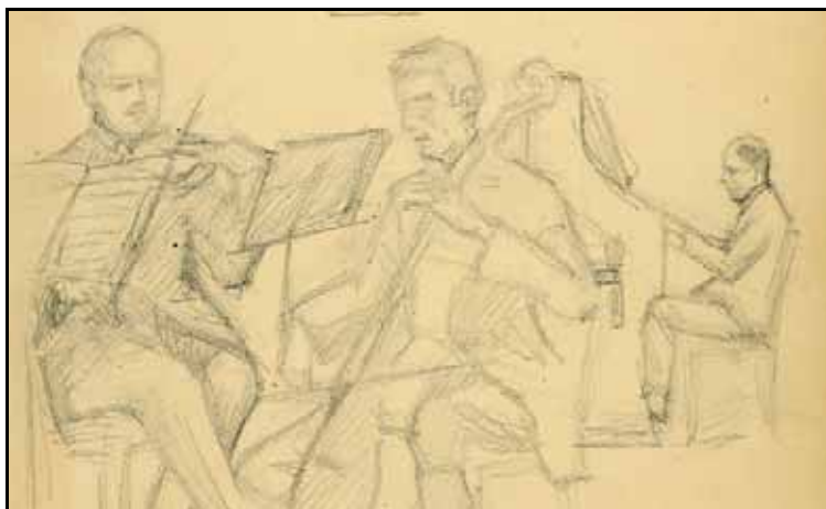
Gästebuch Bd. VI