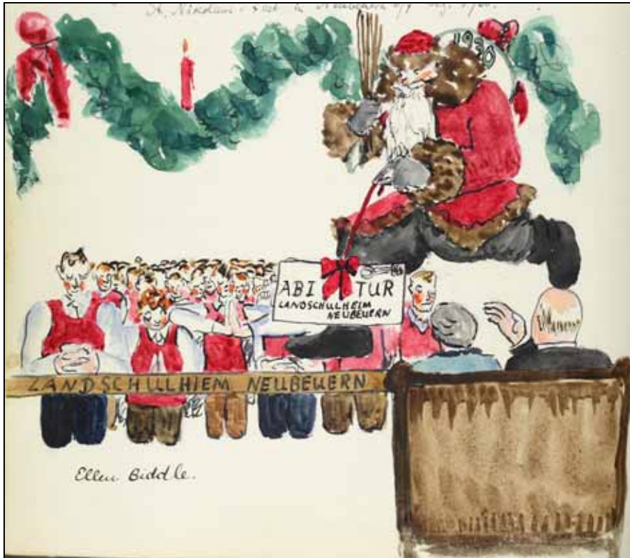
Gästebücher Bd. VII S. 94 Signatur und Bild Abitur Schloss Neubeuern 1930