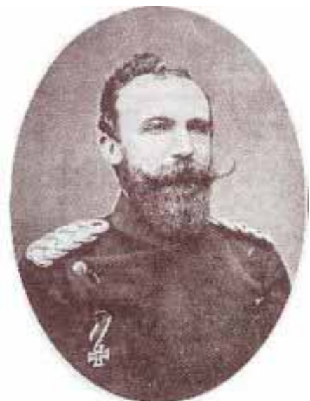
Herzog Friedrich I. von Anhalt-Dessau

Als am 22. Mai 1871 sein Vater starb, folgte ihm Friedrich in der Regierung über die zum Herzogtum Anhalt vereinigten