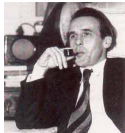
Hans Werner Richter 1947

Leiter der Treffen war Hans Werner Richter . Anfangs entschied er, wer zu den Treffen eingeladen wurde, später beratschlagten ihn Autoren des engen Freundeskreises der Gruppe 47 . Sie fanden im (Halb-)Jahrestakt statt. Dort wurden u. a. unveröffentlichte Manuskripte anwesender Schriftsteller gelesen und kritisiert, sowie die besten ausgezeichnet. Auch ausländische Schriftsteller, Kritiker und andere Gäste wurden regelmäßig eingeladen.