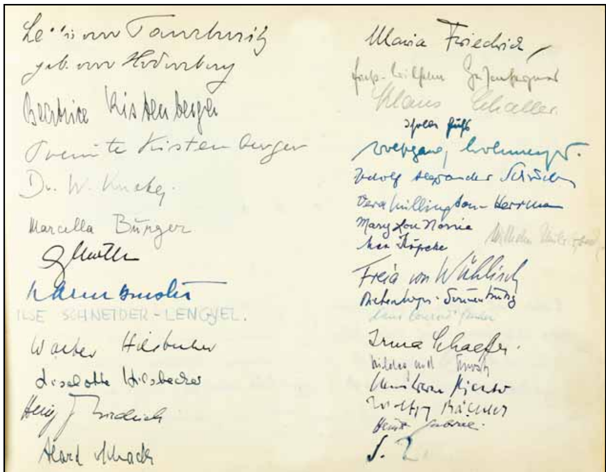
Signaturen des Treffens in Hinterhör im Gästebuch von Hinterhör S. 308