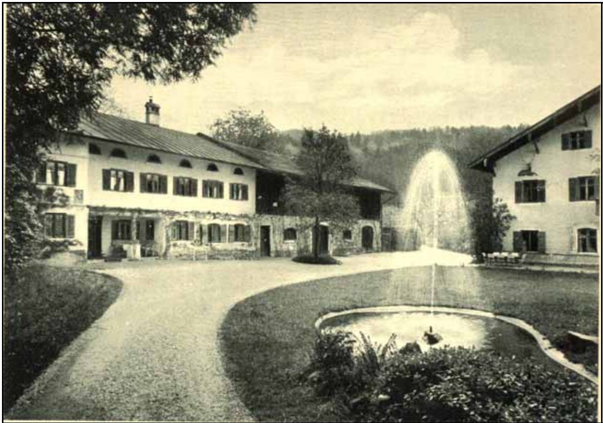
Gut Hinterhör bei Altenbeuern