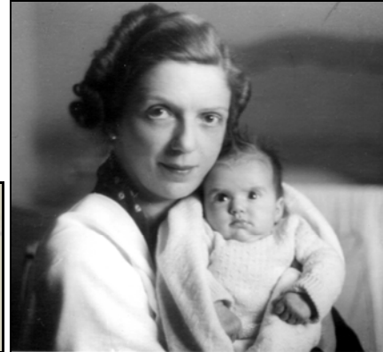
Mafalda mit Moritz

Mafalda Maria Elisabetta Anna Romana , Prinzessin von Savoyen war eine Tochter des Königs Viktor Emanuel III. von Italien und dessen Frau Prinzessin Elena von Montenegro . Mafalda heiratete 1925 Philipp von Hessen (1896-1980). Nachdem Mafaldas Vater Benito Mussolini am 25. Juli 1943 all seiner Ämter enthob, schickte Hitler acht Divisionen nach Italien, um sich der Regierung zu bemächtigen. Viktor Emanuel III. konnte sich in letzter Sekunde mit seiner Familie in den Schutz der Alliierten begeben. Aus Rache ließ Hitler Prinzessin Mafalda in Rom verhaften und nach Buchenwald deportieren, wo sie bei einem Bombenangriff der US Air Force am 24. August 1944 einen Arm verlor und kurz darauf verstarb.