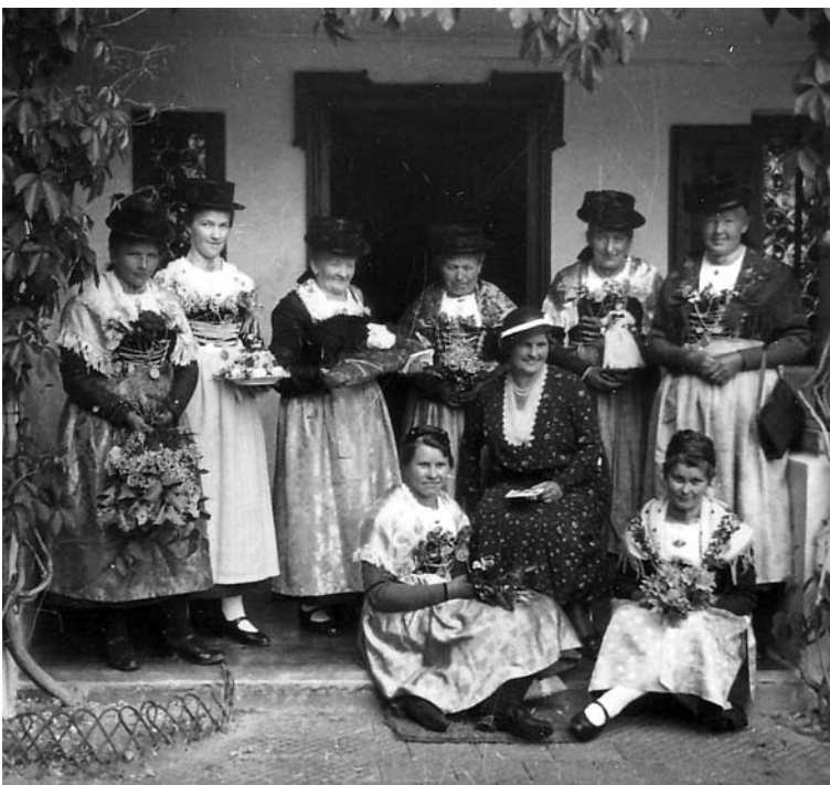
Otonie 1932 50. Geburtstag in Hinterhör