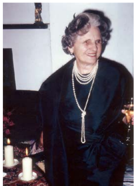
Otonie 1962 80. Geburtstag