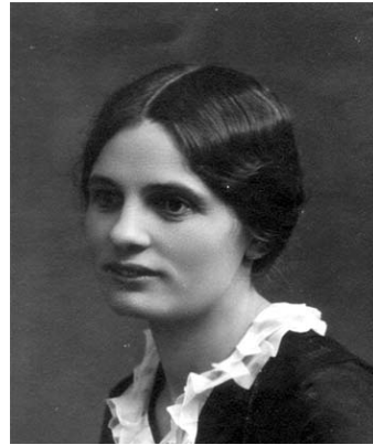
Gästebücher Schloss Neubeuern Bd. V S. 39