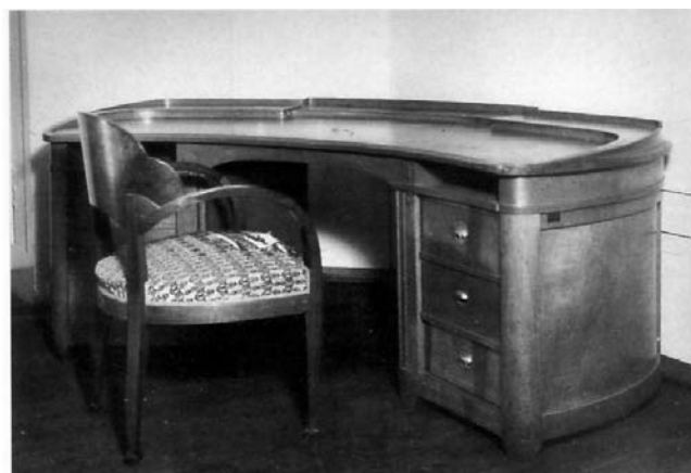
Schreibtisch 1903 und Sessel um 1908 Entwurf Henry van de Velde Hersteller Firma Scheidehammer Weimar