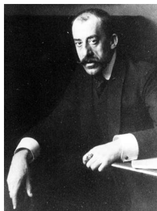
Gästebücher Schloss Neubeuern Bd. V S. 46

gilt heute als einer der Wegbereiter der Moderne in seinem Heimatland Belgien und in Europa. In Frankreich feierte er 1895 seinen ersten Erfolg als Innenausstatter und wurde damit einer der wichtigsten Gründer des »Art nouveau«. In Deutschland, wo er sich um 1900 etablierte, wurde er eine der Hauptfiguren der damals schon blühenden Bewegung des »Jugendstil«. 1902 gründete er das Weimarer »Kunstgewerbliche Seminar«, das Walter Gropius später zum Bauhaus weiterentwickelte. Zurück in Belgien, wurde Henry van de Velde dort ab 1926 eine führende Figur der modernen Architektur. Sein Werk ist das eines freigeistigen Europäers, der über drei Generationen und zwei Weltkriege die politischen, die kulturellen und die stilistischen Grenzen ständig überschritten hat.