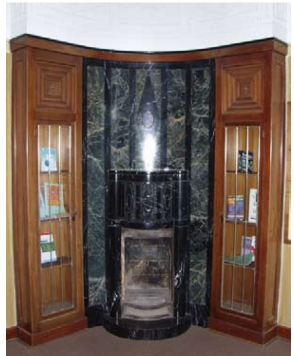
Kamin im „Rosenkavalier Zimmer“ Schloss Neubeuern