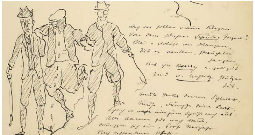
Auszug aus dem Wendelstein Abstieg Silvester 1912 Gästebücher Schloss Neubeuern Bd. V. S. 141