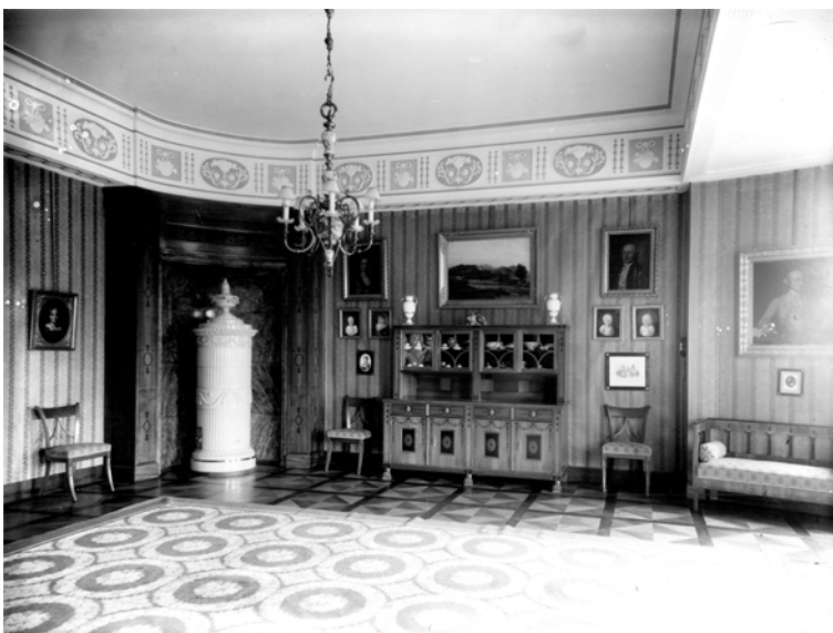
Frühstückszimmer heute „van de Velde Zimmer“ Schloss Neubeuern