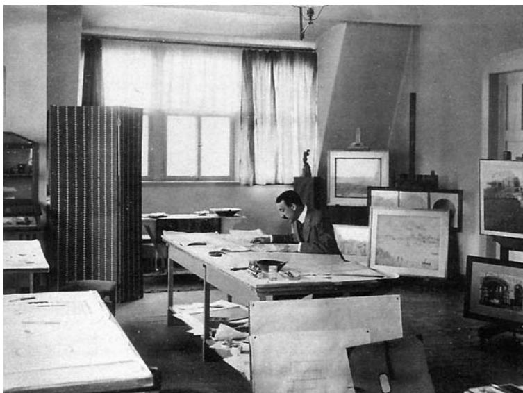
Henry van de Velde in seinem Büro in Weimar

Nach zwei schwierigen Exiljahren in der Schweiz – in Deutschland war der Belgier während des Ersten Weltkriegs nicht mehr erwünscht, in seinem Heimatland galt er als Verräter – zog der Auftrag des Mäzenaten-Ehepaares Kröllner-Müller die Familie van de Velde nach Holland. 1920 bis 1926 war er persönlicher Architekt der Kröllner-Müllers für die Planung ihres Privatmuseums sowie für deren Wohnhaus.