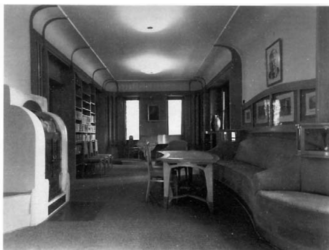
Les- und Vortragzimmer im ehemaligen Nietzsche-Archiv Weimar 1903 nach Entwürfen von Henry van de Velde

Formgestaltung in Weimar Tradition und Gegenwart Weimarer Schriften 29 1988 S. 17-36